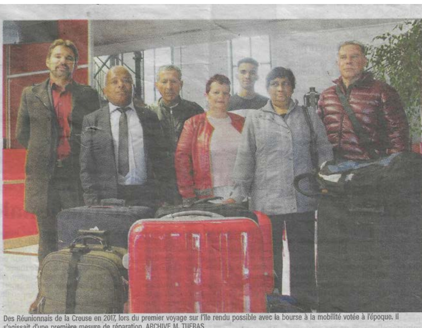
Des Réunionnais de la Creuse en 2017, lors du premier voyage sur l'île rendu possible avec la bourse à la mobilité votée à l'époque. Il s'agissait d'une première mesure de réparation.

Un choc, tant les attentes d'un nouveau chapitre étaient grandes, témoigne, madame Périgogne. Et qui a conduit la FEDD à mettre les bouches doubles tout au long de l'année : 128 victimes ont écrit aux députés des circonscriptions où ils